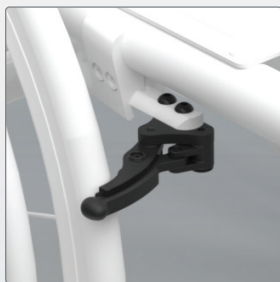
Remmen Korte schaarremmen