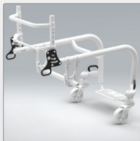
Transportbevestiging Goedgekeurd voor transport ISO 7176-19