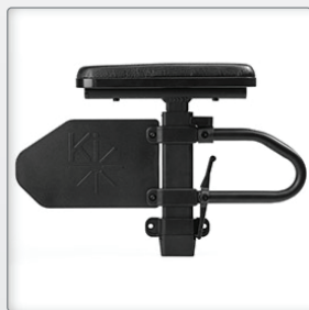
ArMLEuning In hoogte verstelbaar met polstering