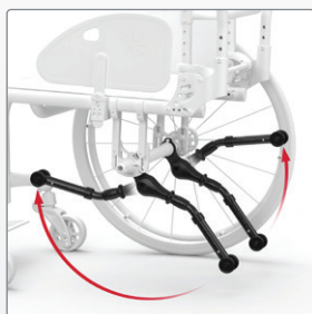
Anti-tip Zelf te bedienen