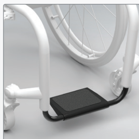
Voetenplaat In hoek verstelbaar