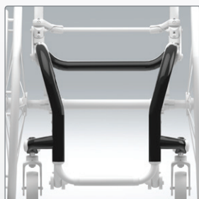
Voorframe Een U-vorm of een V-vorm