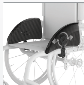
Spatborden Verstelbare aluminium spatborden met polstering