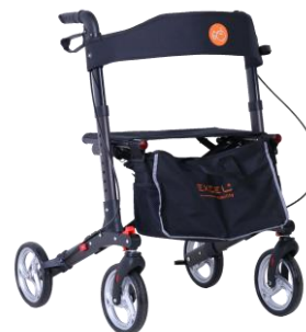
De getoonde productfoto kan afwijken van de standaard configuratie.