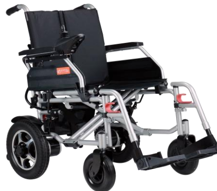
De getoonde productfoto kan afwijken van de standaard configuratie.

Let op: een eventueel opgegeven actieradius is volgens opgave van de fabrikant, gemeten onder ideale omstandigheden en met aangepaste snelheid. Van invloed kunnen zijn: gebruikersgewicht, weersomstandigheden, snelheid, bandendruk, wegomstandigheden, conditie van de accu's en het wel of niet heuvelachtige landschap.