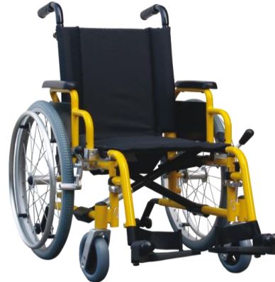
De getoonde productfoto kan afwijken van de standaard configuratie.