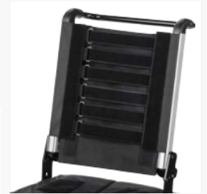
*Anpassitz und -Rücken