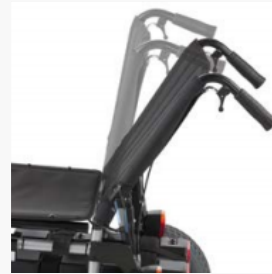
*30° Rückenverstellung optional wählbar