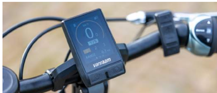
Silent smart display

Een aantal van onze elektrische fietsen is voorzien van het Silent smart display. Dit display bestaat uit een knoppenunit waarmee je gemakkelijk wisselt tussen ondersteuningsstanden en een informatiescherm waarop je onder andere de afgelegde afstand en resterende accucapaciteit kunt zien.