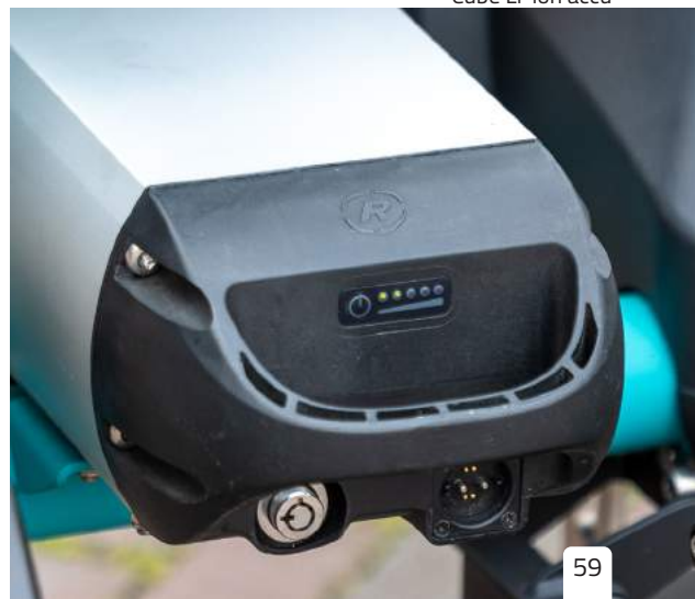
Cube Li-ion accu

Op het display kun je de status van je accu bekijken. De accu indicatie geeft aan hoe vol de accu nog is. Ook op de accu is deze indicatie aan de hand van LED's te zien. Deze accu indicatie bestaat uit vijf groene LED's waarvan de meest linkse ook rood kan branden.