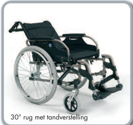
30° rug met tandverstelling

In 3 hoogtes en dieptes instelbare armleggers