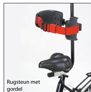
Rugsteun met gordel