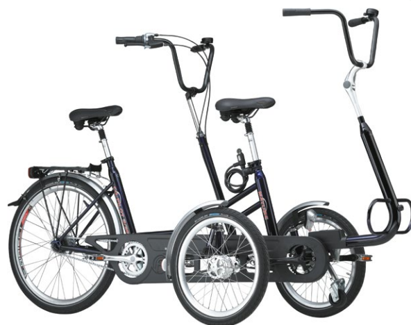
Copilot 3/24 met afhaakbaar voorwiel en kader