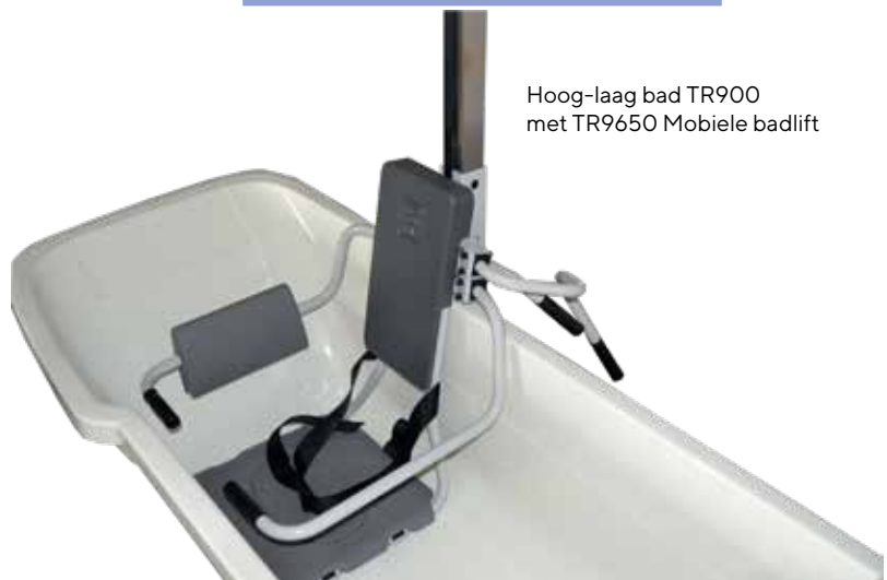
Hoog-laag bad TR900 met TR9650 Mobile badlift