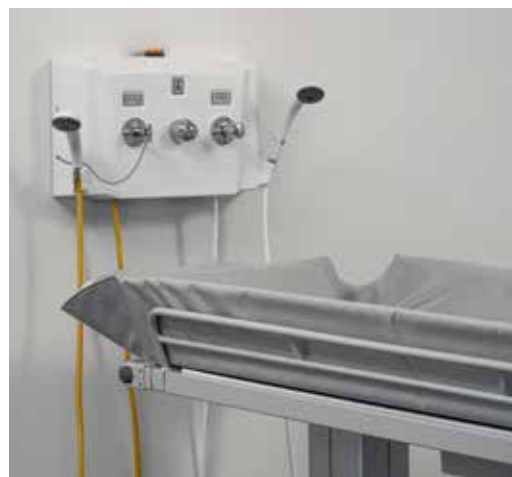
TR 2810 Douchepaneel met TR4200 Douchebrancard