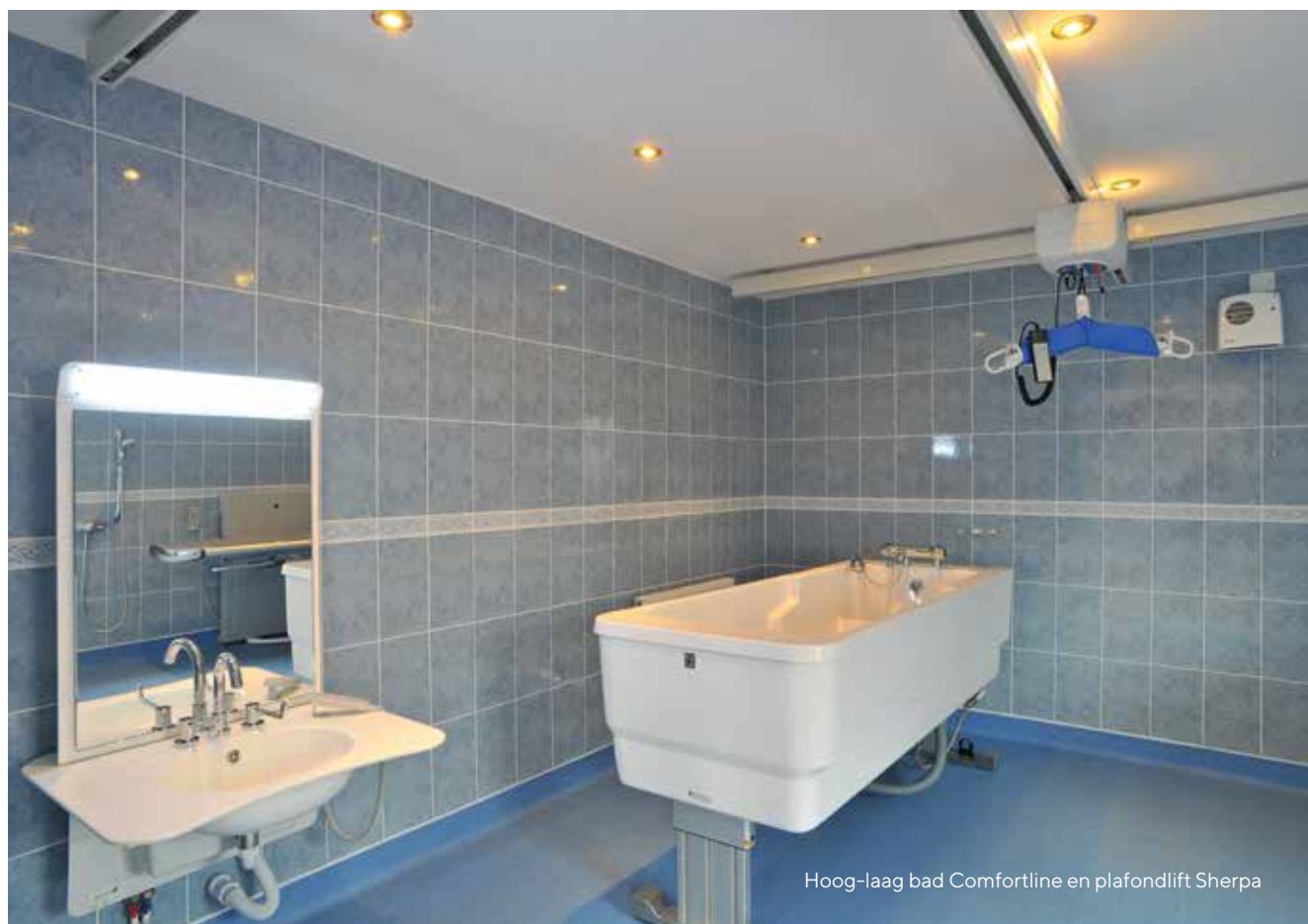
Hoog-laag bad Comfortline en plafondlift Sherpa