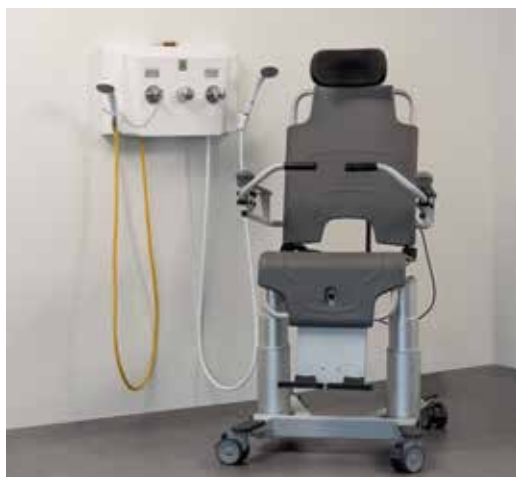
TR 2810 Douchepaneel met TR9650 Mobiele badlift