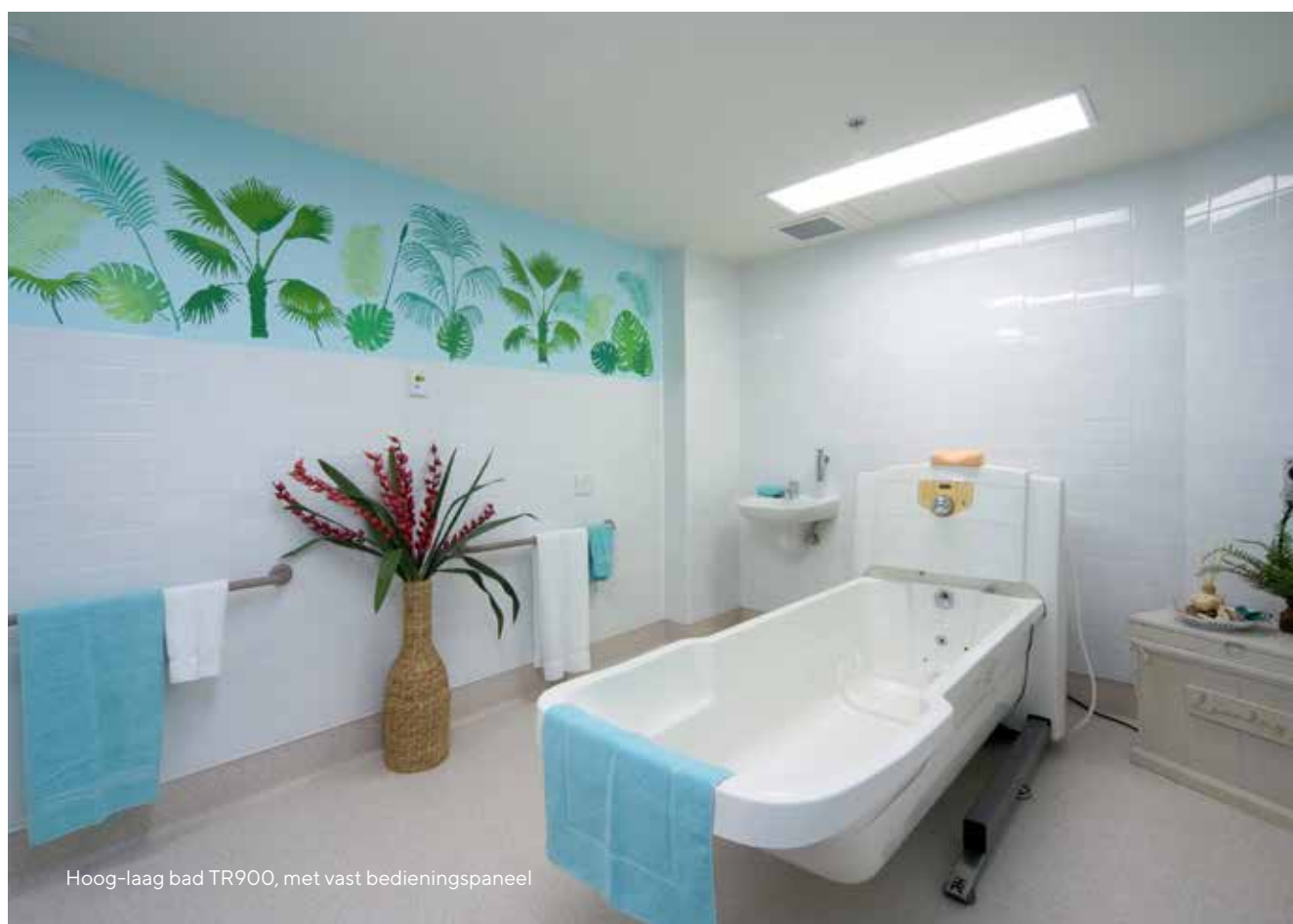
Hoog-laag bad TR900, met vast bedieningspaneel