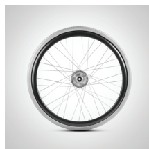
Achterwiel 20, 22, 24"