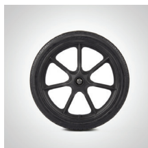
Achterwiel 12", 16"