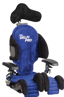
Delfi Pro maat 4