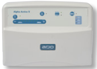
BEGELEIDE AANPASSING VAN DE CELDRUK

De pomp detecteert het standaardgewicht in de actieve modus (alternerende druk) en past de druk in de cellen aan met behulp van de automatische beveiliging voor een betere ondersteuning van de zorgvrager.