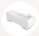
Classic Line 2

1. Goto et al (2014). Physical and mental effects of bathing: A Randomised Intervention Study. Evidence-Based Complimentary and Alternative Medicine. Volume 2018, Article ID 9521086. 2. Branco M, Rêgo NN, Silva PH et al. Bath thermal waters in the treatment of knee osteoarthritis: a randomized controlled clinical trial. Eur J Phys Rehabil Med. 016;52(4):422-30. 3. Silva A, Queiroz SS, Andersen ML, et al (2013). Passive body heating improves sleep patterns in female patients with fibromyalgia. Clinics (Sao Paulo) 68(2): 135-139. 4. Knibbe NE, Knibbe JJ (1996). Postural Load of nurses during bathing and showering of patients: Results of a laboratory Study. American Society of Safety Engineers. November. 37-39.