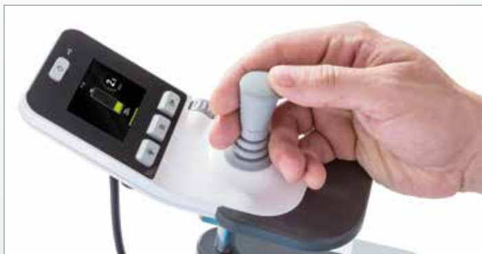
Informatief kleuren display met gebruiksvriendelijke bedieningen