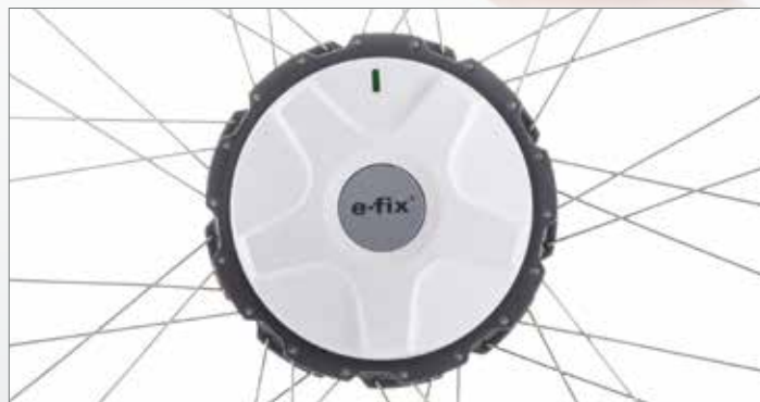
Compact, stil en krachtig: de e-fix rijwielen