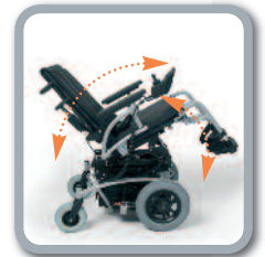
Elektrisch inclineerbare rug en zit