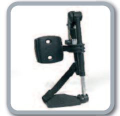
Optie : BZ7-E Elektronisch regelbare voetsteunen