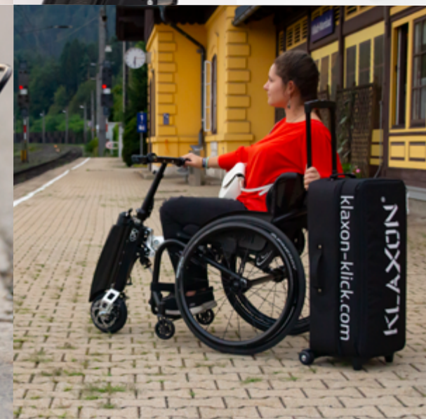
Linking System Klaxon® - Brevetto mondiale