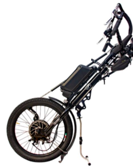
Linking System Klaxon® - Brevetto mondiale