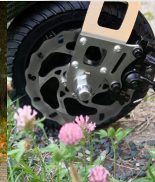
Linking System Klaxon® - Brevetto mondiale