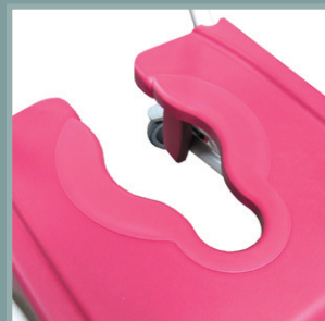
Bouchon d'assise adaptif.