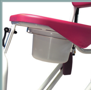
Seau avec rails de guidage.