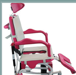
Ensemble coussin d'assise + dossier.