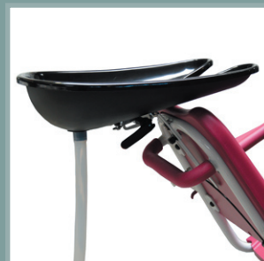
Bac à shampooing réglable et amovible.