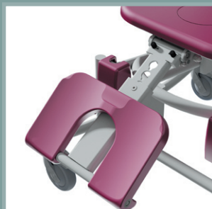
Option repose-jambes réglable.