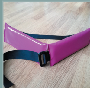
Jeu de 2 protections étanches pour ceinture de maintien.