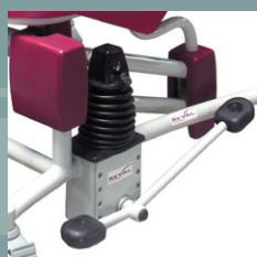
Pédale de levage hydraulique