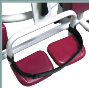
Sangles de maintien des pieds du patient.