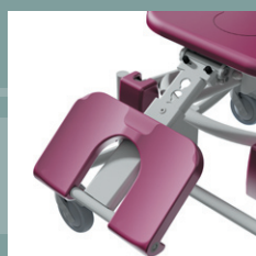
Option repose-jambes 5600.50