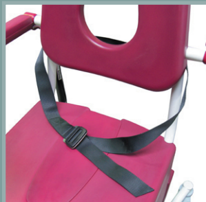
Ceinture de maintien abdominale.