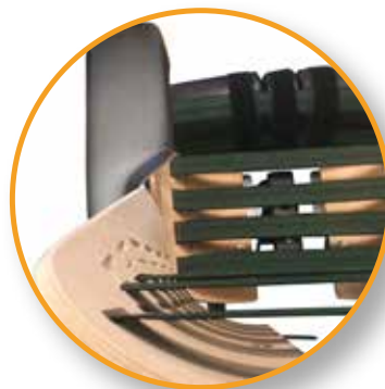
Asymmetrisch instelbare singels (o.a. bij kyfose)