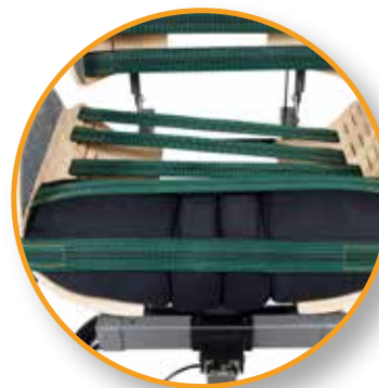
Goede positionering van het bekken