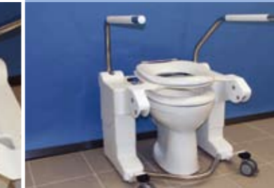
Type Mobiel (MO)