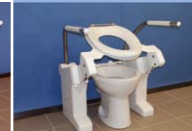
Type Standaard (ST) Staand