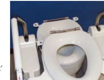
Type Mobiel (MO) detail