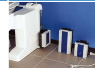
Type 24Volt (24V)