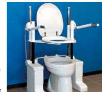
Model Vertical (VE)