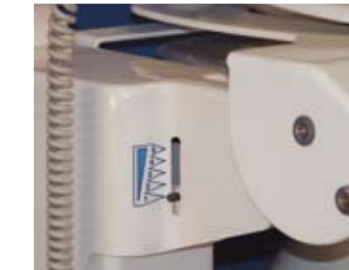
Type Automatic (AU)