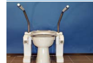
Type Small (SM)