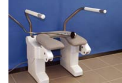
Type Douche (DO)