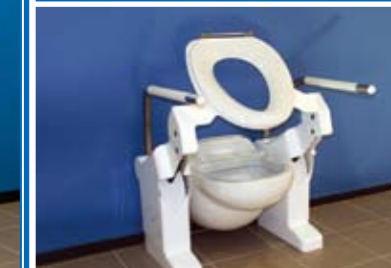
Type Sani Broyeur (SA)