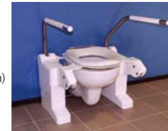
Type Standaard (ST) Hangend