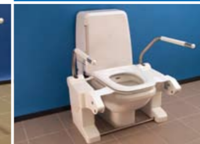
Type (GE) 7000