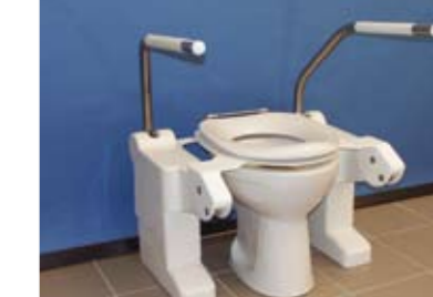
Type Bariatric (BA)