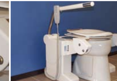
Type Automatic (AU)