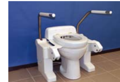
Type Spoel-Föhn (SF)