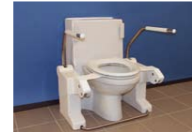
Type Closomat (CL)