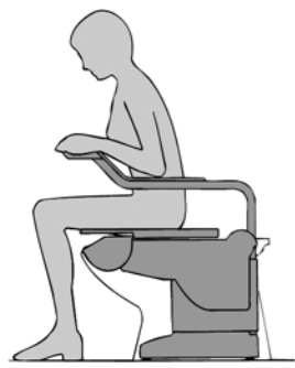
De laagste stand is de normale brilhoogte