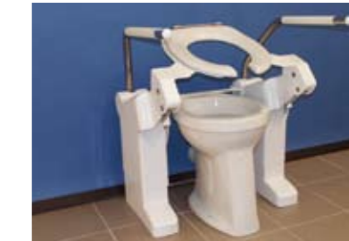
Type Non-Contact (NC)