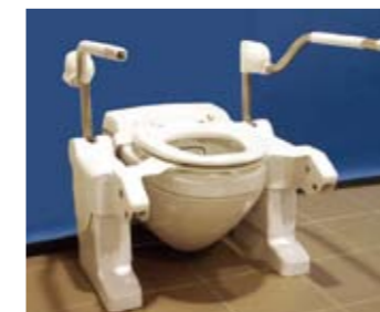
Type (GE) 8000