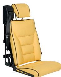
DHT 2 | Luxuspolster, langes Sitzkissen