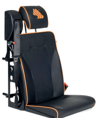
DHT 1 | Lehne vorklappbar, kurzes Sitzkissen