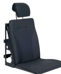
DHT 4 | Standardversion, langes Sitzkissen, ohne 3-Punkt Gurt