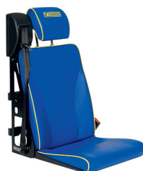
DHT 3 | Standardversion, langes Sitzkissen