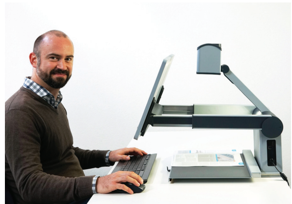
Visio 500: Lesen und Schreiben in Full HD Auflösung