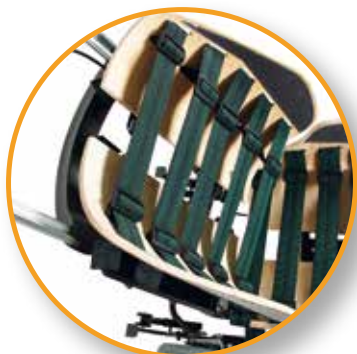
Asymmetrisch instelbare singels (o.a. bij kyfose)