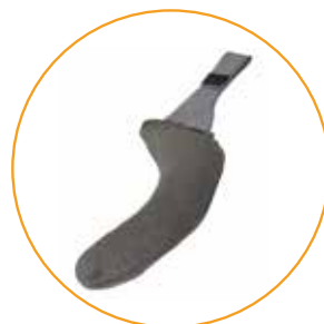
Voor flexibele armleggers