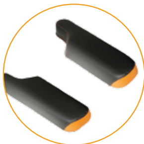
P-vormige armleggers 12 cm breed