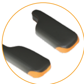
P-vormige armleggers 16 cm breed