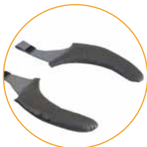
Flexibele armleggers in platilon