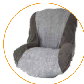
Voor compleet Nuage PLS zitsysteem