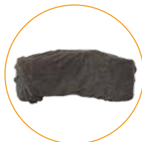
Voor hoofdsteun en hoofdsteun klein