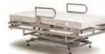
mobilia integra (basismechaniek)