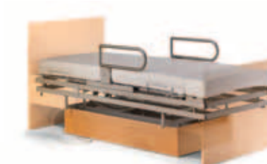
mobilia integra (bed in bed)