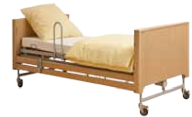
medial plus, uitgangspositie