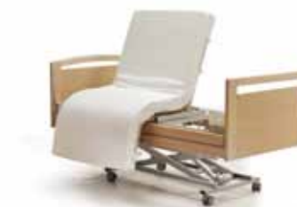
mobilia cura e