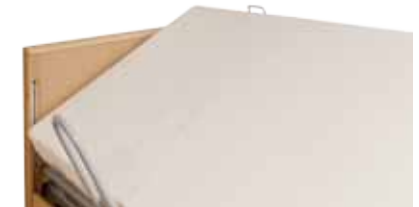
medial plus, schuinzetten 21 graden