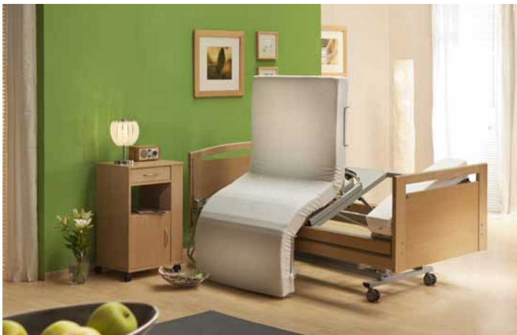
mobilia casa e plus

mobilia e plus staat voor het luxe model van ons bed voor speciale verpleging en daarmee ook ons opstabel. Met zijn veelzijdige functies, voor alles echter een volledig motorisch draaibaar ligvlak met een net zo volledig motorische opstafunctie, is dit bed op dit moment uniek op de markt. In zijn totaliteit is dit bed zeker de optimale oplossing voor een scala van de meest uiteenlopende verplegingsbehoeften. Mobiliteit is met mobilia cura e plus zeer gemakkelijk.