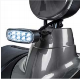
Nieuwste LED techniek