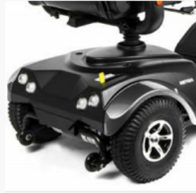
1.600 Watt Motor