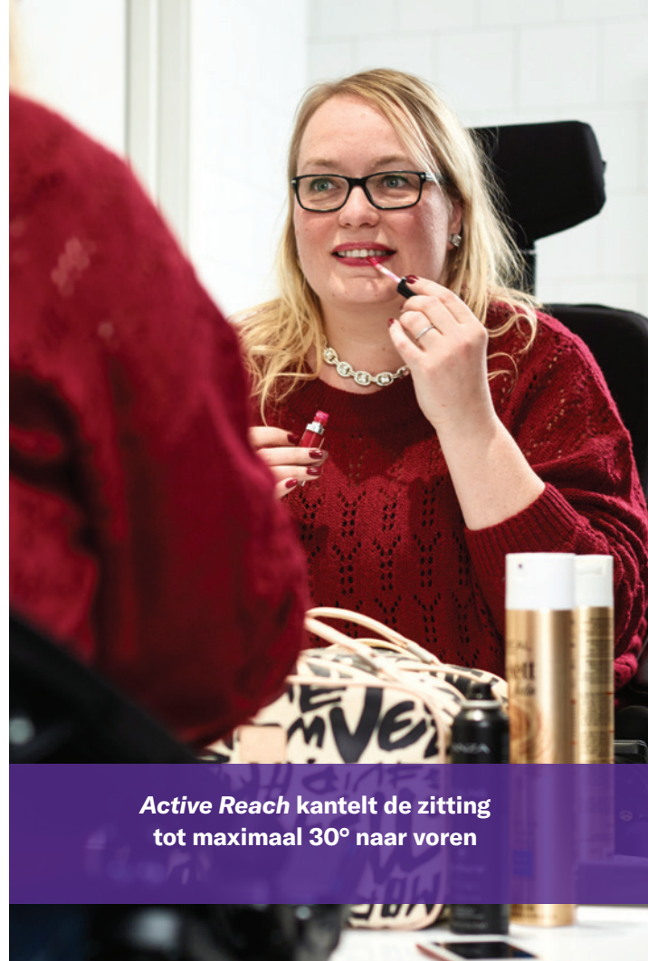
Active Reach kantelt de zitting tot maximaal 30° naar voren

QuickConfig is een nieuwe, innovatieve app voor service-monteurs, adviseurs en therapeuten, die het eenvoudiger maakt om parameters in te stellen en een intuïtieve interface biedt om de F3 Corpus af te stellen op basis van de door u gewenste rij- en zitkenmerken.