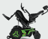
Achterwaartse kantelverstelling 0- 50°