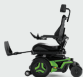
Elektrische en manuele Beensteun 90-180°