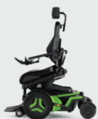
Voorwaartse kantelverstelling Active Reach* 5-30° Voor 20° en 30° is een VS-beensteun nodig