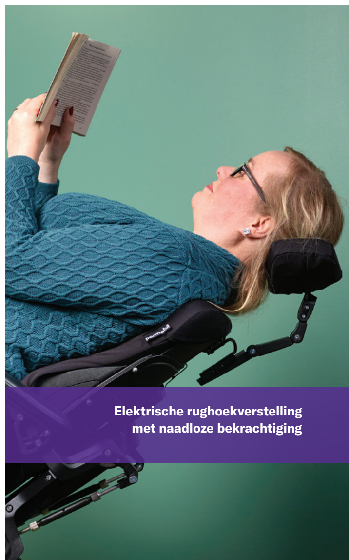
Elektrische rughoekverstelling met naadloze bekrachtiging