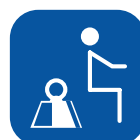
Max. gebruikersgewicht ▼