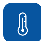
Max. reinigingstemperatuur hoes ▼